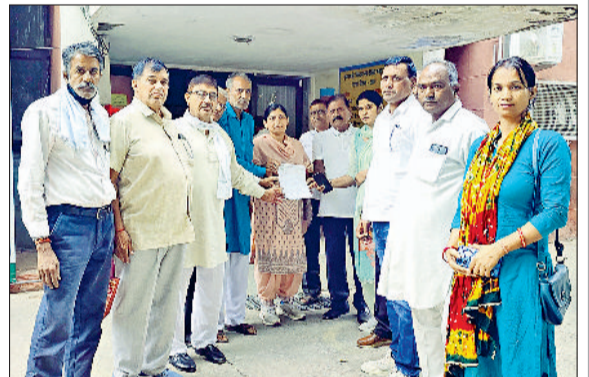
रेवाड़ी। मार्केट कमेटी में ज्ञापन सौंपते हुए भाकियू चढ़नी के सदस्य।

वीरवार को नई अनाजमंडी में बास मार्केट साइड व सचिवालय साइड के दोनों गेटों के पास सुबह से ही जाम की स्थिति बनी रही। अनाजमंडी में खरीदी गई फसल का उठान भी काफी धीमा चल रहा है, जिससे जगह की कमी होती जा रही है, जिससे किसान बाजरा व कपास सड़क पर डाल रहे हैं। सड़क पर बाजरे की डेरियां लगने से वाहनों की कतार लगने से जाम के हालात पैदा हो रहे हैं।