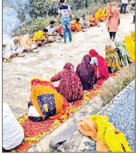
नारनौल। अन्नकूट में प्रसाद ग्रहण करते हुए।

पावन पर्व पर रात्रि जागरण व अन्नकूट भंडारे का आयोजन किया गया। बता दें कि गोवर्धन पर्व, गोपाष्टमी, देवउठनी एकादशी व कार्तिक पूर्णिमा की सात किलोमीटर की परिक्रमा मार्ग आई जाती है। इस पूर्ण परिक्रमा का मार्ग में डोसी धाम के