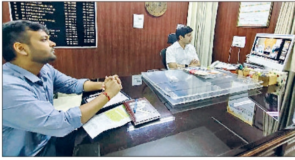
हरियाणा दिवस और गीता महोत्सव को लेकर वीसी में भाग लेते डीसी व एडीसी।

हरियाणा सरकार की ओर से हरियाणा दिवस को पूरे उमंग, उत्सास और उत्साह के साथ भव्य रूप से मनाया जाएगा। जिला मुख्यालय पर एक नवंबर को हरियाणा दिवस पर जिला स्तरीय कार्यक्रम का गरिमामयी ढंग से