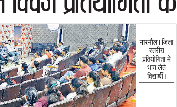
राउंड, विजुअल राउंड व रैपिड फायर राउंड शामिल थे। इन चारों राउंडों के संयुक्त अंकों के आधार पर शीर्ष पांच टीमों का चयन गुरुग्राम में होने वाली मंडल स्तरीय प्रतियोगिता हेतु किया गया। कार्यक्रम की मुख्य अतिथि डॉ.