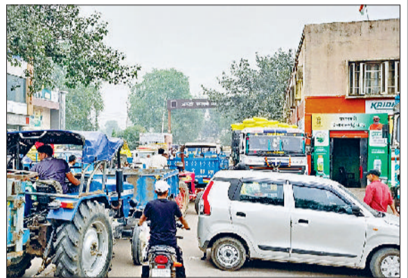
रेवाड़ी। वीरवार को अनाजमंडी के मुख्य गेट पर लगा जाम।