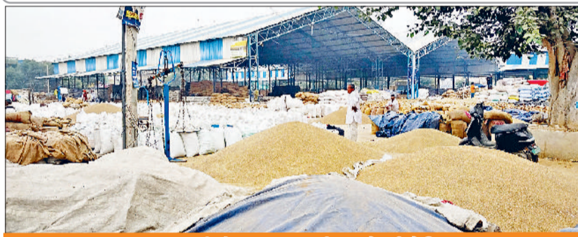
अनाजमंडी में फसल पर लगी बाजरे की डेरियां