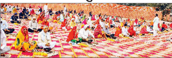
महेंद्रगढ़। गोशाला में आयोजित यज्ञ में भाग लेते हुए।