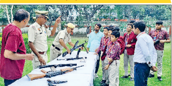
रेवाड़ी। पुलिस शस्त्रों की जानकारी लेते हुए छात्र।