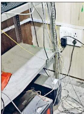
रेवाड़ी। डहीना सब तहसील में खराब पड़े इन्वर्टर व बैट्री तथा मोबाइल टॉर्च की रोशनी में कार्य करते हुए नाब तहसीलदार।

सब तहसील की व्यवस्था इन दिनों बीमार चल रही है। आलम यह है कि अफसर से लेकर फरियादी तक लाचार नजर आते हैं। सबसे बड़ी समस्या पावर बैकअप की बनी हुई है। बिजली गुल होते ही तहसील परिसर में पूरी तरह अंधेरा छा जाता है। तहसीलदार के कक्ष में भी बिजली जाने के बाद मोबाइल फोन की टॉर्च से काम चलाया जा रहा है। इस सब तहसील के अधीन आसपास के 33 गांव आते हैं। इन गांवों के सैकड़ों लोग अपने कार्य के लिए तहसील परिसर आते हैं। तहसील परिसर में सुविधाओं के नाम पर कुछ नहीं है, तो परेशानियों की काई कमी नहीं है। सबसे बड़ी परेशानी बिजली से जुड़ी हुई है।