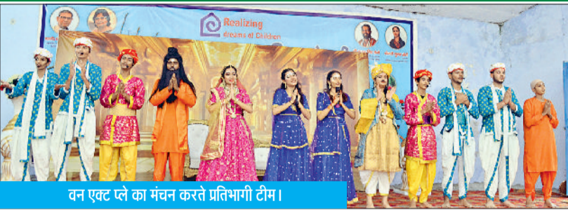
वन एक्ट प्ले का मंचन करते प्रतिभागी टीम।