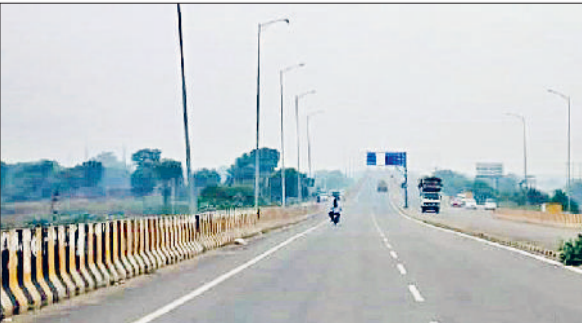
रेवाड़ी। वीरवार को दिन भर आसमान में छाई रही धुएं की परत।

नहीं आने दिया। इससे दिन के समय मौसम ठंडा हो गया। अधिकतम तापमान 3.5 डिग्री सेल्सियस गिरकर 26.0 डिग्री पर आ गया। न्यूनतम तापमान 3.8 डिग्री सेल्सियस बढ़कर 16.0 डिग्री पर पहुंच गया। इससे रात के समय ठंड का असर कम रहा।