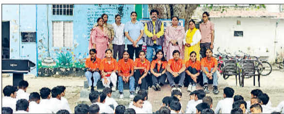
रेवाड़ी। विद्यार्थियों को जागरूक करते हुए नुककड़ नाटक की टीम।

लौह पुरुष सरदार वल्लभभाई पटेल के जन्मदिन 31 अक्टूबर को भारतवर्ष में राष्ट्रीय एकता दिवस के रूप में मनाया जाता है। जिला पुलिस की ओर से राष्ट्रीय एकता दिवस व राष्ट्रीय सुरक्षा के संदर्भ में जागरूकता अभियान चलाया जा रहा है। वीरवार को डीएसपी ट्रैफिक पवन कुमार सहित प्रबंधक थाना नाहड़, डीएचो पब्लिक स्कूल, राजकीय गार्ल्स, धारूहेड़ा, सेक्टर-6 धारूहेड़ा, कोसली, रामपुरा, कसौला, रोहड़ाई, महिला