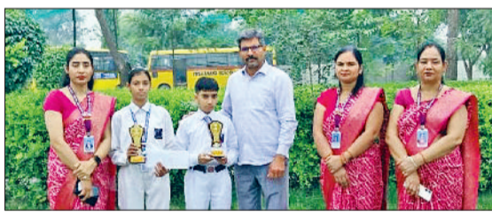
रेवाड़ी। विजेता विद्यार्थी शिक्षकों के साथ।