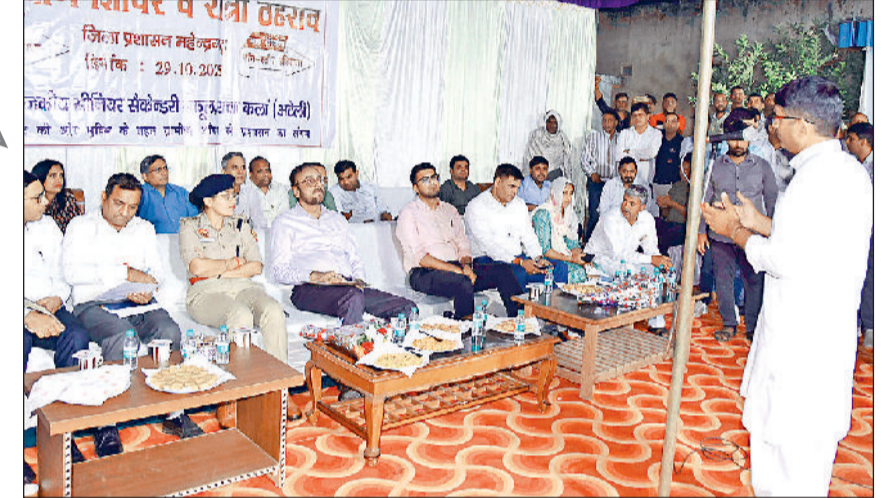
नारनौल। रात्रि ठहराव में समस्याएं सुनते डीसी व एसपी।