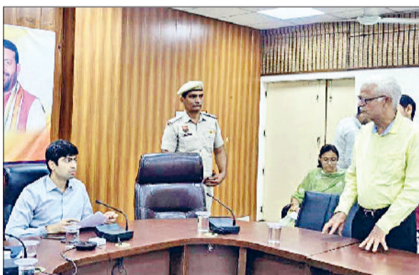
रेवाड़ी। समाधान शिविर में आमजन की समस्याओं को सुनते हुए डीसी अभिषेक मीणा।

डीसी अभिषेक मीणा ने वीरवार को लघु सचिवालय स्थित सभागार में आयोजित समाधान शिविर में अधिकारियों के साथ जनसमस्याओं को सुना और उनका मौके पर समाधान किया। डीसी ने नागरिकों से जिला और उपमंडल स्तर पर आयोजित किए जा रहे समाधान शिविरों का लाभ उठाते हुए अपनी समस्याओं का निवारण कराने का आह्वान भी किया। समाधान शिविर में जमाबंदी में नाम सही करने की शिकायत पर राजस्व विभाग के अधिकारियों को त्रुटि दुरुस्त करने के निर्देश दिए गए। गांव गंगायचा अहीर में खेतों में पानी भरने की शिकायत पर डीसी ने डीडीपीओ को मौके पर जाकर जांच करते हुए जल निकासी के निर्देश दिए। गांव चांदावास व शहर